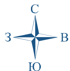
Схема автомобильных дорог (улиц) д. Б. Протопопово, мкр. «Авиатор 1», мкр. «Авиатор 2»